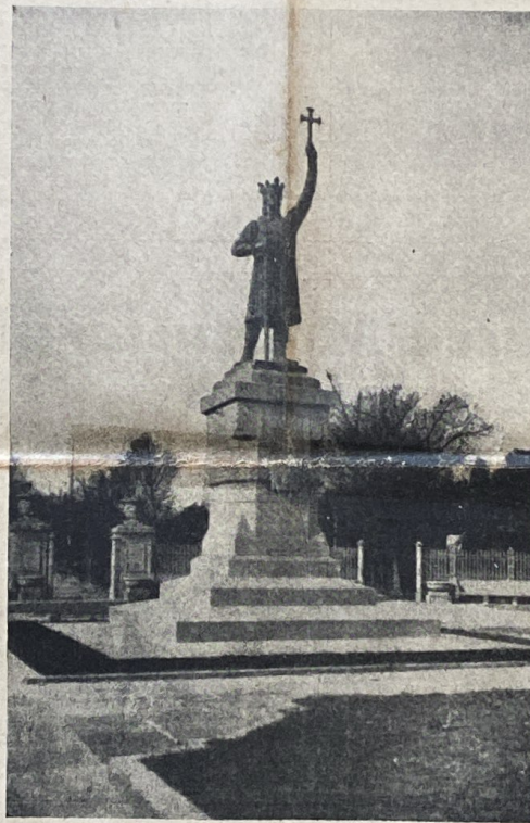
STEFAN VODA DOMNUL ROMANILOR Statuia din Chisinaul Basarabiei